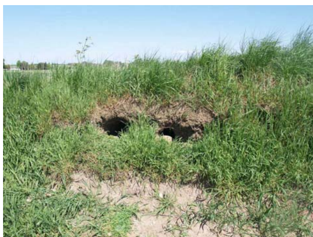
Der er rævegrave