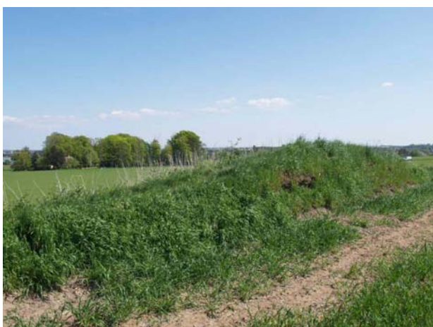
Der pløjes helt ind til resterne af højen.

Trunshøj er en rundhøj fra yngre stenalder eller bronzealder. Diameter oprindeligt 18 m, højde 2 m. Meget beskadedt, idet højen er bortgravet på begge sider af skellet. Resterne af højen ligger i skellet og der er pløjet af højen fra begge sider, så det er kun den del af højen der ligger i skellet der er tilbage. Navnet Trunshøj står i indberetningen fra sognepræst A.F. Worsøe til Oldsagskommissionen i 1808.